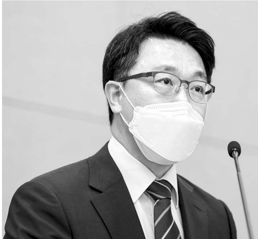
김진욱 고위공직자수사처장이 17일 경기 정부과천청사에서 취임 후 첫 기자간담회를 갖고 있다.

김 처장은 이날 이성윤 고검장 ‘황제 소환’ 논란에 대해 사과하기도 했다. 김 처장은 이 고검장이 서울중앙지검장 시절이던 지난 3월 7일 ‘김학의 전 법무부 차관 불법 출국금지(출금) 의혹 사건과 관련해 이 고검장을 면담하기 위해 자신의 관용차를 제공한 사실이 드러나 논란이 일었다. 김 처장은 이에 대해 “공정성 논란이 일지 않도록 좀 더 신중하고 무겁게 일처리를 했어야 했는데, 그렇지 못한 점 사과드린다”며 “지난간 과오라